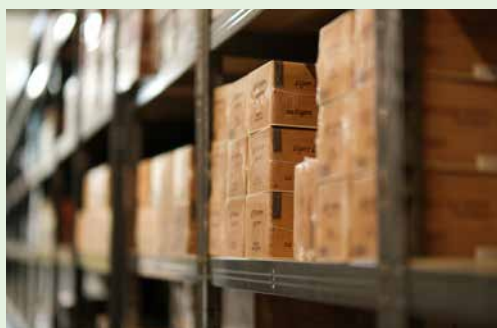
Aus unserem 250 m 2 -Lager in Dübendorf beliefern wir den Schweizer Zigarren-Fachhandel.

«New World Cigars» ist die Sammelbezeichnung für Zigarren, die ausserhalb Kubas hergestellt werden – insbesondere in Nicaragua, Honduras und der Dominikanischen Republik. Die Bedeutung von Zigarren aus diesen Herkunftsländern wuchs in den vergangenen Jahren stark.