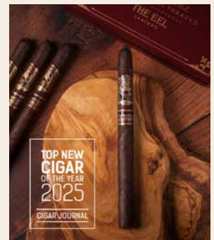
Ein neues Lancero-Format mit spektakulären Aromen

Die El Pulpo The Eel betont durch ihre schlanke Konstruktion die Aromen des dunklen Deckblatts aus Mexiko: Röstnoten, Holz, Heu, Kokos, Gewürze. Die Lancero hält eine schöne Balance, deutet ab und zu etwas Säure an, verliert sich nie in bitteren Abgründen, und richtet den vollen Fokus auf das spektakuläre Aromenspiel. Auch das Cigar Journal ist begeistert und wählte die El Pulpo The Eel zur «Top New Cigar of the Year 2025».