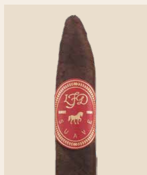
La Flor Dominicana legt die Suave-Serie neu auf

Im Sortiment von La Flor Dominicana zählt die neue Suave zu den leichteren Blends. Trotz ihres Namens – «suave» bedeutet «weich» oder «sanft» – bleibt die Marke ihrem Stil treu. Die helle Variante entwickelt Eindrücke von Holz, Vanille und Süsse. Über die Suave Gran Maduro schreibt das Portal Halfwheel: «Eine Schokoladen-Bombe».