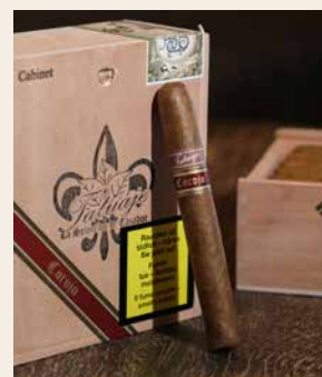
Corona-Gorda-Format mit neuen Deckblättern