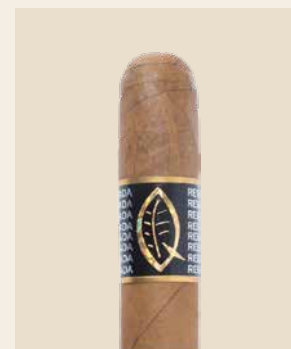
Das Aroma von Stein und Wasserfall

Die Quesada Reserva Privada wird mit gereiften Tabaken der Ernte 1997 gerollt. Diese Vintage-Tabake haben über die Jahre viel Nikotin verloren. Zurück bleibt ein feines mineralisches Aroma. Was etwa so schmeckt wie ein Stein, wenn man an ihm leckt. Oder etwas prosaischer: der Duft eines Wasserfalls. Die geübte Nase riecht sofort, wenn diese Zigarre mit Charakter im Fumoir brennt. Die mineralische Note wird durch eine feine Süsse, nussige Eindrücke und Röstnoten ergänzt.