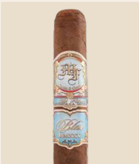
Der Erstling von My Father Cigars aus Honduras

My Father präsentierte letztes Jahr mit der Linie Blue ihren Erstling aus Honduras. Die mittelkräftige Honduras-Puro fiel mit einer eigenständigen Aromatik mit Süsse und Noten von Bitterorange auf und legte einen fulminanten Start hin. Sie gewann die Consensus-Wertung von Halfwheel – eine Metastudie des Branchenportals, welche Ratings aus aller Welt auswertet. In der Leserwahl zur Zigarre des Jahres des deutschen Zigarrenmagazins belegte die My Father Blue Platz zwei – punktgleich hinter der Siegerzigarre aus Kuba.