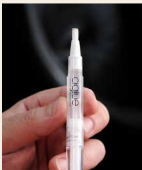
Ciglupe repariert Zigarren im Handumdrehen

Ein Riss im Deckblatt – und vorbei ist es mit dem Rauchvergnügen? Der Reparaturstift Ciglupe ist der praktische Retter in der Not. Er enthält einen natürlichen und geschmacksneutralen Leim, der mit einem Pinsel punktgenau auf die beschädigte Stelle aufgetragen wird. Ein Drehmechanismus verhindert, dass Schmutz in den Behälter gelangt.