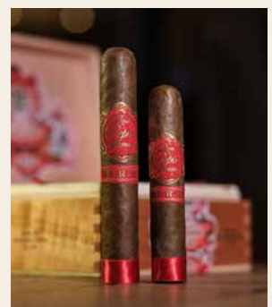
The Judge in Leicht: My Father El Rey de los Habanos