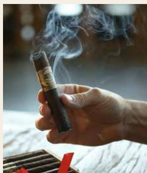
Un champion du rapport qualité-prix signé Quesada

La Casa Magna Maduro élargit le line-up de la marque à succès avec un blend doté d'une cape mexicaine. La sous-cape provient du Nicaragua, les tabacs de tripe du Nicaragua, les tabacs de tripe du Nicaragua, de la République dominicaine et des États-Unis. La ligne Maduro perpétue la recette du succès de la marque Casa Magna: des blends aromatiques avec un excellent rapport qualité-prix. Les cigares séduisent par un profil complexe aux notes torréfiées et de café, de noix, de bois et de douceur – tout en restant étonnamment doux et digestes.