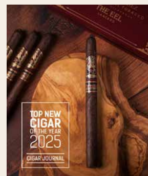
Un nouveau format Lancero aux arômes spectaculaires

La El Pulpo The Eel met en valeur, grâce à sa construction élançée, les arômes de la cape sombre du Mexique: notes torréfiées, bois, foin, coco, épices. La Lancero maintient un bel équilibre, laisse parfois apparaître une légère acidité, ne bascule jamais dans des amertumes excessives et concentre toute l'attention sur un jeu aromatique spectaculaire. Le Cigar Journal est lui aussi enthousiaste et a désigné la The Eel «Top New Cigar of the Year».