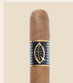
L'arôme de pierre et de cascade

La Quesada Reserva Privada est roulée avec des tabacs vieillissés issus de la récolte 1997. Ces tabacs vintage ont perdu une grande partie de leur nicotine au fil des années. Il en reste une fine note minérale. Quelque chose qui rappelle le goût d'une pierre que l'on lèche. Ou, de manière plus prosaïque: le parfum d'une cascade. Un nez averti reconnaît immédiatement ce cigare de caractère lorsqu'il se consume dans le fumoir. La note minérale est complétée par une fine douceur, des impressions de noix et des notes torréfiées.