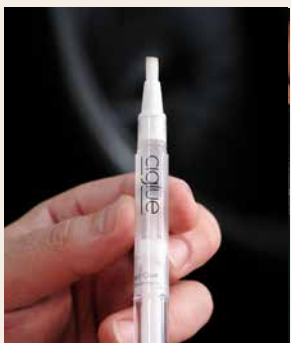
Cliglu répare les cigares en un clin d'œil

Une fissure dans la cape – et le plaisir de fumer est terminé? Le stylo de réparation Cliglu est le sauveur pratique en cas d'urgence. Il contient une colle naturelle et neutre en goût, appliquée avec un pinceau directement sur la zone endommagée. Un mécanisme rotatif empêche que des impuretés ne pénètrent dans le récipient.