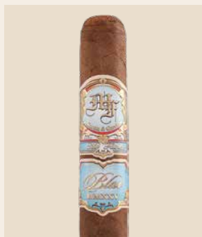
La première création de My Father Cigars issue du Honduras

L'année dernière, My Father a présenté avec la ligne Blue sa première création issue du Honduras. Ce puro hondurien de force moyenne s'est distingué par une aromatique singulière, avec de la douceur et des notes d'orange amère, et a connu un départ fulgurant. Il a remporté le Consensus de Halfwheel – une méta-analyse du portail qui évalue des notes du monde entier. Lors du vote des lecteurs pour le cigare de l'année du magazine allemand Zigarrenjournal, le My Father Blue s'est classé deuxième – à égalité de points avec le cigare vainqueur de Cuba.