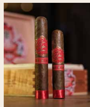
The Judge en léger: My Father El Rey de los Habanos